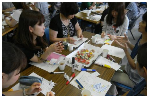
病院&在宅看護の連携カフェでの自己紹介