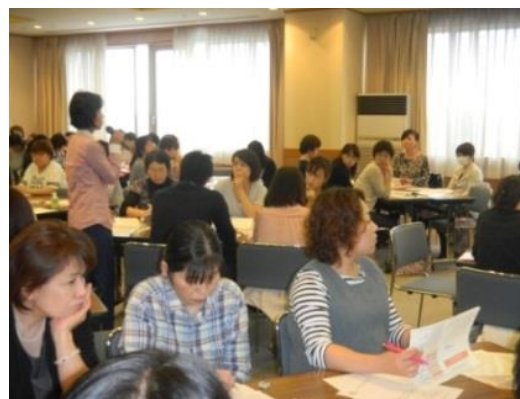
事例検討会での全体討議