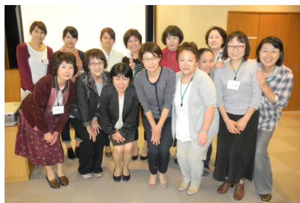
第 2 回 講師（前列左から 3 人目）を囲んで