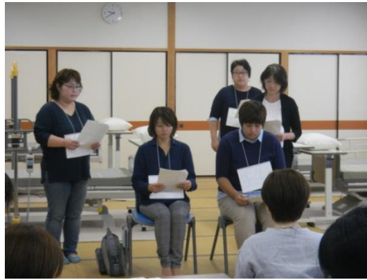
実習指導場面の発表