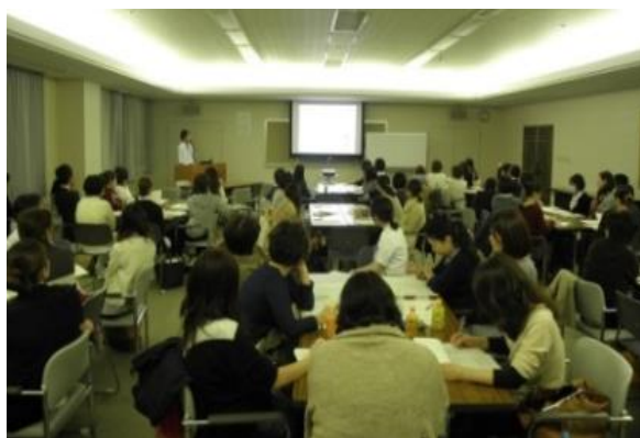
病院看護師による退院支援事例紹介